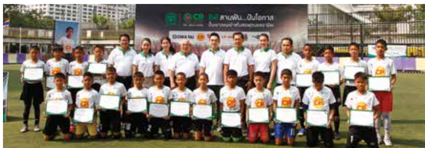
● 20 นักเตะรุ่นเยาว์ จากโครงการซีพี สานฝัน...ปันโอกาส “ปั้นเยาวชนเข้าสู่สโมสรฟุตบอลอาชีพ” รุ่น 2 ได้รับประกาศนียบัตร

“ช่วงแรกๆ ผมก็ต้องไปทะเลาะกับทางบ้านนิดหนึ่ง (ยิ้ม) แต่ต้องคุยให้เข้าใจ สุดท้ายครอบครัวเราก็ตอบรับที่จะสนับสนุนเขา เพียงแต่สิ่งหนึ่งที่จะบอกเขาเสมอก็คือ ห้ามทิ้งการเรียน ดังนั้น สิ่งหนึ่งที่เราประทับใจโครงการนี้มากก็คือในระหว่าง 6 ปี ถ้าเด็กเกิดบาดเจ็บ ไปต่อไม่ได้ในเส้นทางฟุตบอลอาชีพ แต่เขาก็ยังจะได้รับทุนการศึกษาจนจบแน่นอน ผมประทับใจแนวคิดตรงนี้มากครับ”